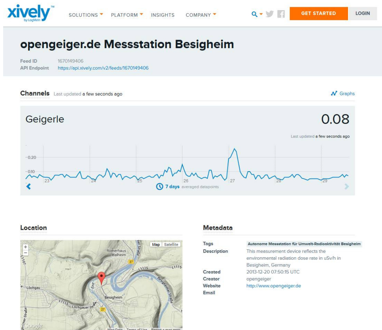
Abb. 1: Anzeige des Messprotokolls der Geigerle-Messtation in Besigheim im Mess-Portal des Dienstes Xively (früher Pachube)

Die nur wenige Kilometer westlich von Besigheim gelegene ODL-Messtation Löchgau zeigt genau wie die Geigerle-Messtation am 26.4. eine schwache Erhöhung und am 27.4. einen starken Peak, der nach wenigen Stunden abgeklungen war. Die Messtation im Stuttgarter Schlossgarten zeigt dagegen nur den Peak in der Nacht zum 27.4 ganz deutlich. Dieser Peak überschreitet sogar die Alarmgrenze, klang aber dann schneller ab, als der Niederschlag. Damit kann man davon ausgehen, dass es sich um einen natürlichen Fallout handelt. Es bedeutet aber auch, dass die Geigerle Messtation in Besigheim mit einer sehr hohen Empfindlichkeit gut funktioniert. Die Geigerle-Messtation erreicht ihre Empfindlichkeit durch ein spezielles Glasfaserfilter, welches das Regenwasser für eine gewisse Zeit vor dem Detektorfenster speichert.